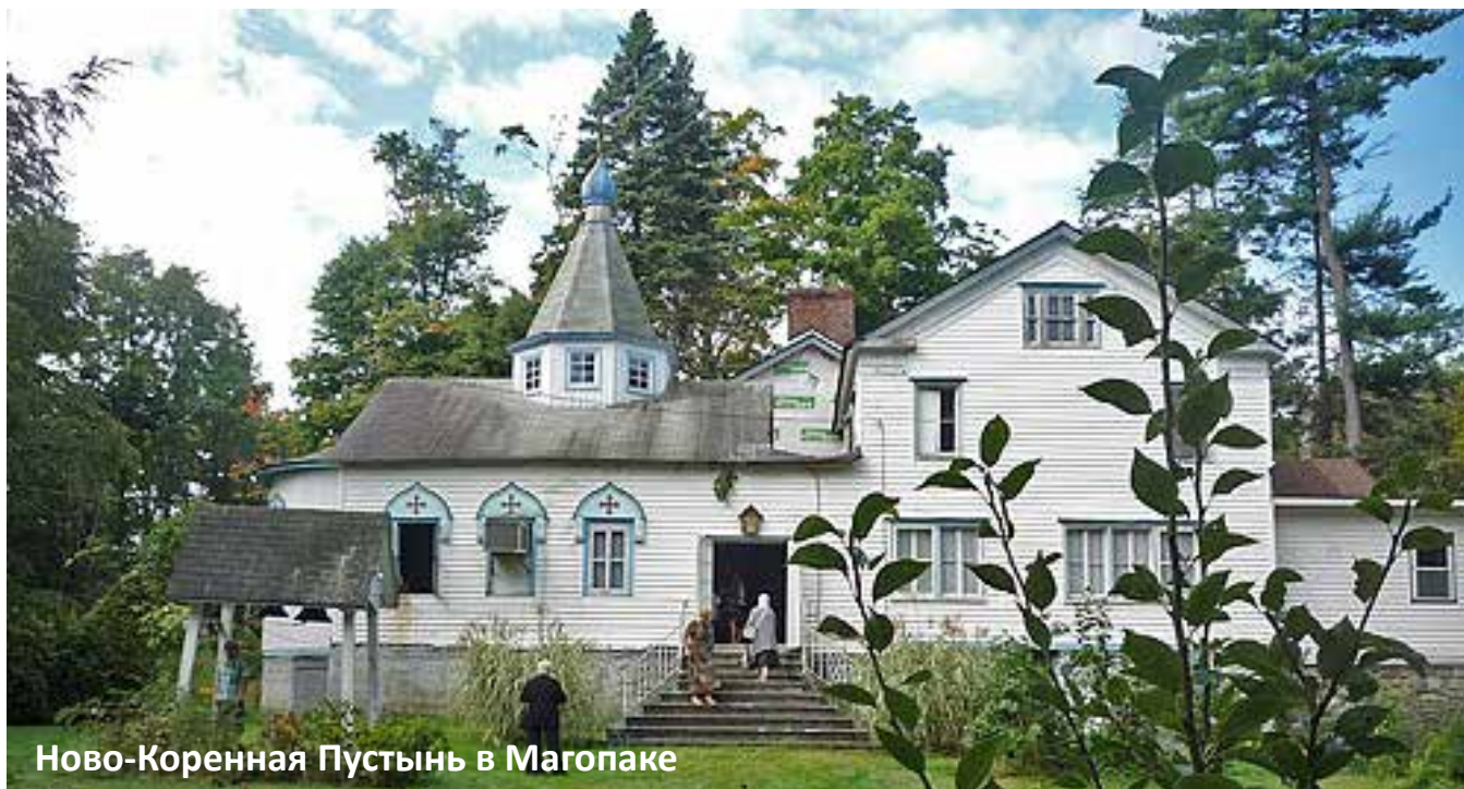
Ново-Коренная Пустынь в Магопаке

истинным «приятелем сирых, странников предстательницей, благой утешительницей всех, прибегающих к ней с усердием и верою». Много чудес свершилось в это время от Чудотворного образа Божией Матери.